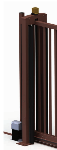
Pile guide du portail coulissant automatisé