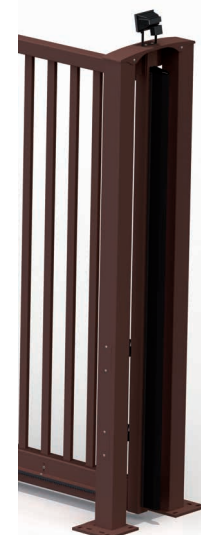
Pile de réception du portail coulissant automatisé