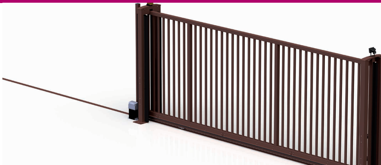
Couleur : Corten