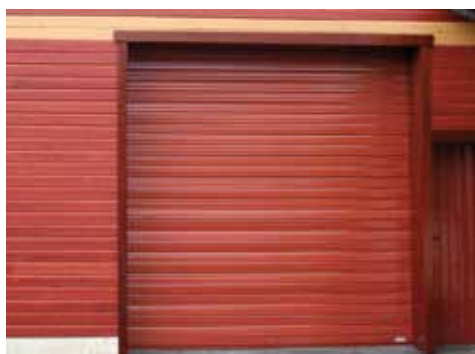
Rideau Murax 110 laqué époxy (option)

Grâce à son profil de lame exclusif, le rideau Murax 110 offre une rigidité maximum et répond aux plus hautes exigences de sécurité. Il offre le meilleur rapport qualité/prix. Il est le plus vendu en France.