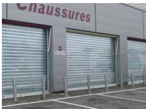
Rideaux Murax 110 galvanisés