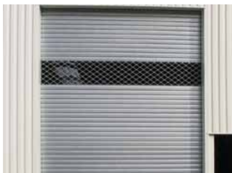
Mixage rideau Murax 110 et grille Dentel (option)