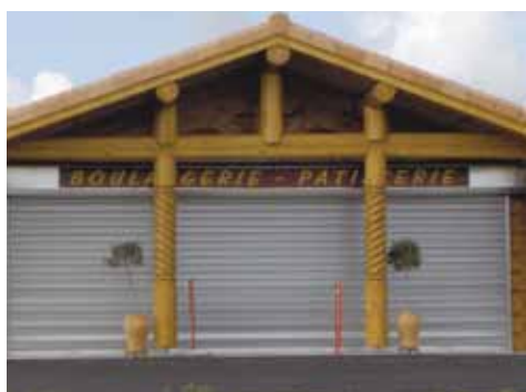
Rideau Murax grande largeur